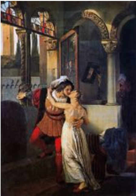
Le dernier baiser de Roméo et Juliette de Francesco Hayez (1823)