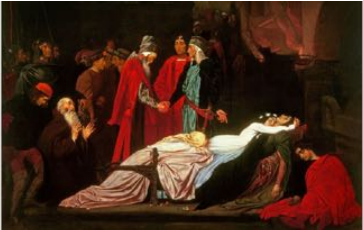
La Réconciliation des Montaigu et des Capulets devant les corps de Roméo et Juliette de Frederic Leighton (1855)

Rosaline , premier amour de Roméo mais elle le repousse. Elle est la cousine de Juliette