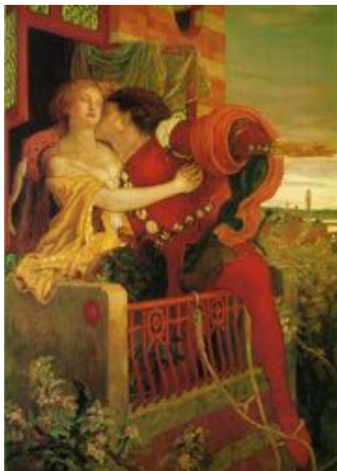
La scène du balcon par Ford Madox Brown (1870)