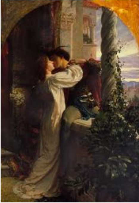
Roméo et Juliette, par Sir Franck Dicksee (1884)