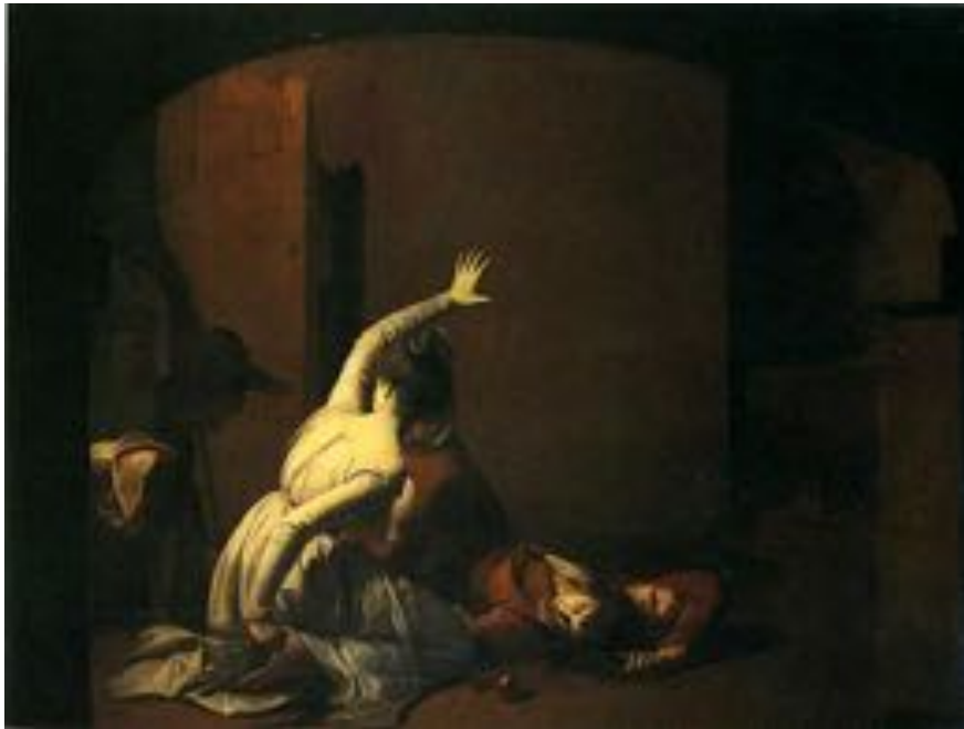
La Scène du tombeau, par Joseph Wright of Derby (1790).